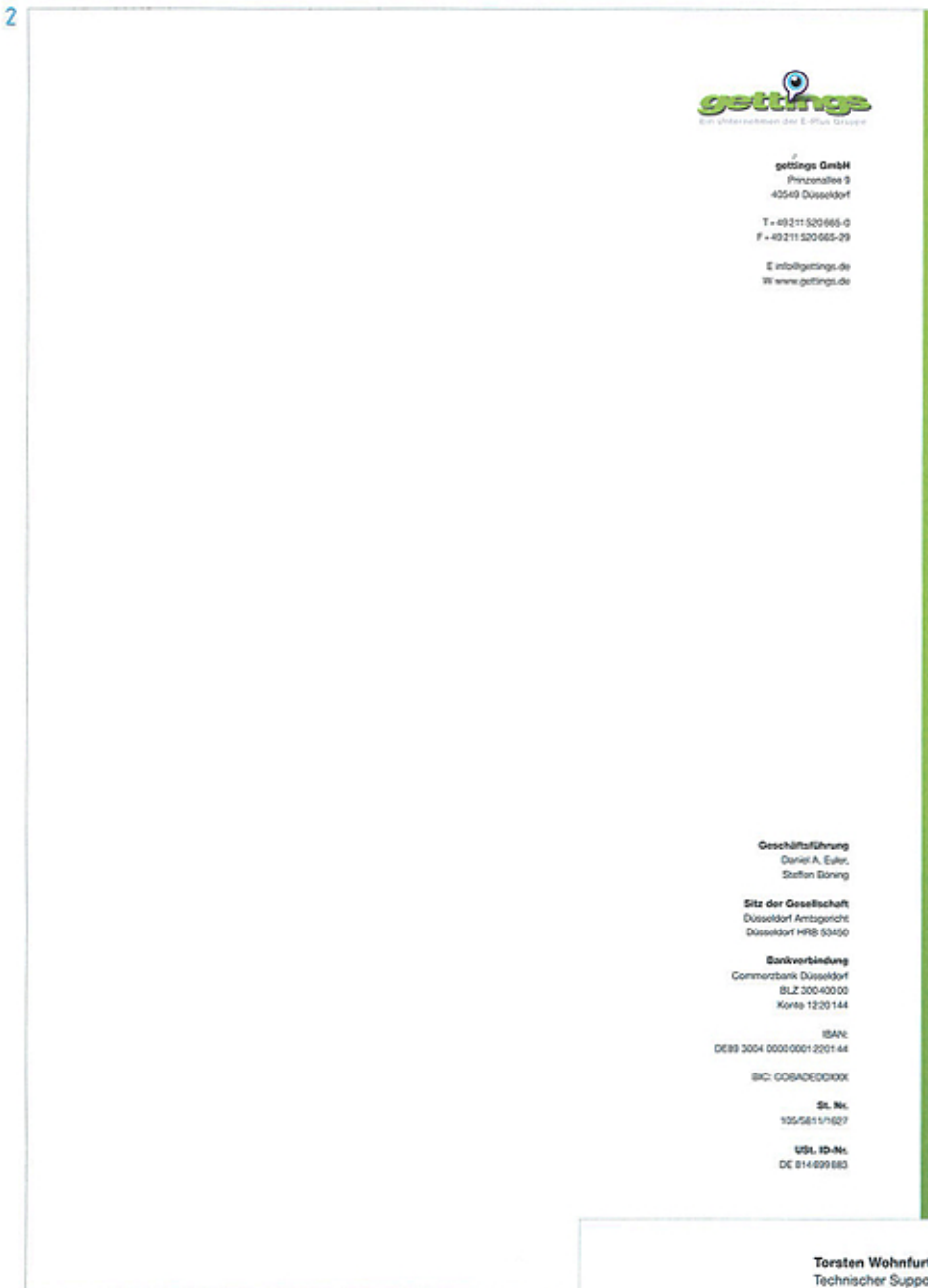
1 Markenlogo 2 Geschäftsausstattung